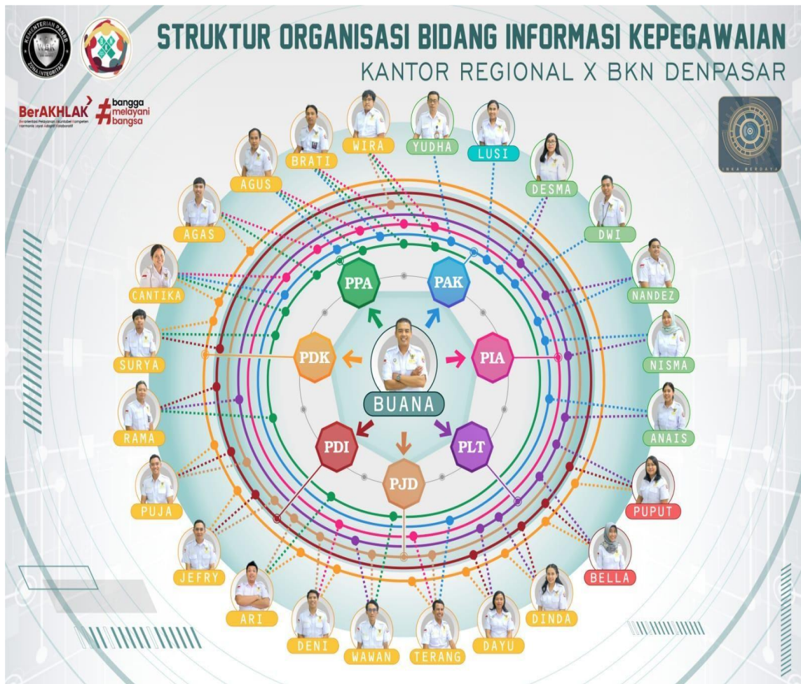
Gambar 2.2 Struktur Organisasi Orbit Berbasis Pokja

Struktur Organisasi Orbit merupakan struktur baru hasil rumusan dari penulis dan belum pernah ada sebelumnya. Struktur ini dirancang sebagai jawaban atas kebutuhan struktur yang lebih agile, efektif dan juga kolaboratif yang ditujukan untuk Efektivitas pencapaian target-target organisasi, meningkatkan kompetensi pegawai/staff/squad sebagai tindaklanjut implementasi dari kebijakan penyederhaan birokrasi. Struktur ini memberikan telah memberikan manfaat diantaranya: